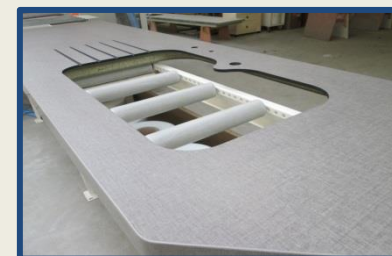
Plan Compact 10mm doublé plaqué chant ABS ; usinages sur mesure: décor Sixty Grigio