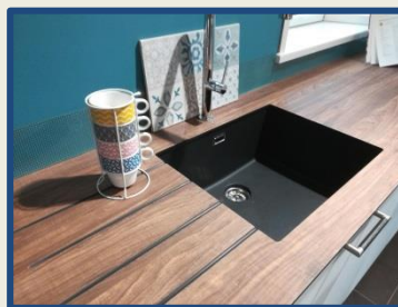
Plan en Compact 10mm âme noire avec usinage égouttoir : décor Noyer Vintage