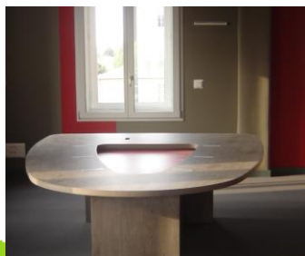
Table sur mesure pour un studio radio