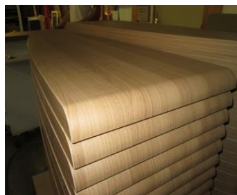
Éléments stratifiés postformés, usinés et plaqués en série