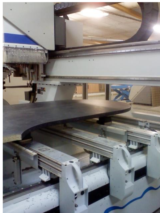
Usinage et placage de chants courbes ABS, de l'unité à la série