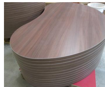
Éléments stratifiés usinés et plaqués en série