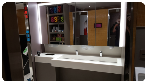
Sanitaires Notre-Dame de Paris

Nous proposons une gamme avec une quarantaine de cuves et vasques injectées ou thermoformées pouvant être intégrées aux plans en résine. Certains modèles de la gamme ont un fond en inox. Possibilité de coller par-dessous des éviers en inox.