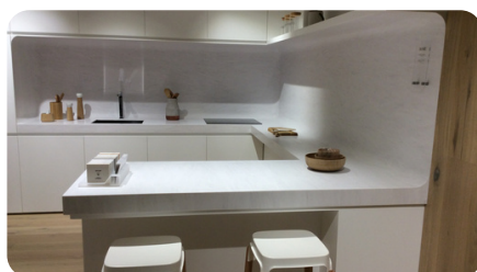
Cuisine résine blanche