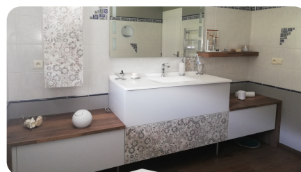
Plan de vasque