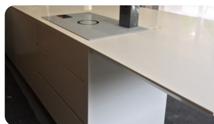
Îlot de cuisine