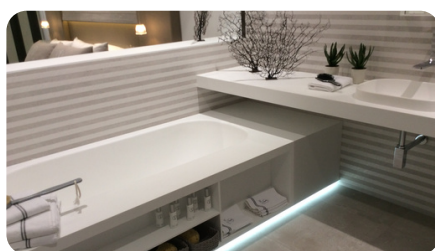
Plan de vasque & baignoire