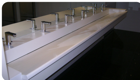
Evier avec pan incliné - La MAIF