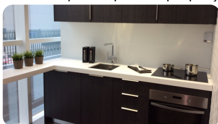
Plan de travail