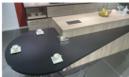
Plateau sur mesure