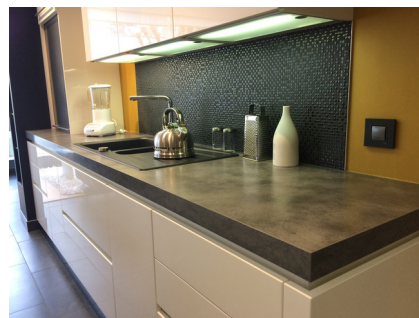
Plan de travail