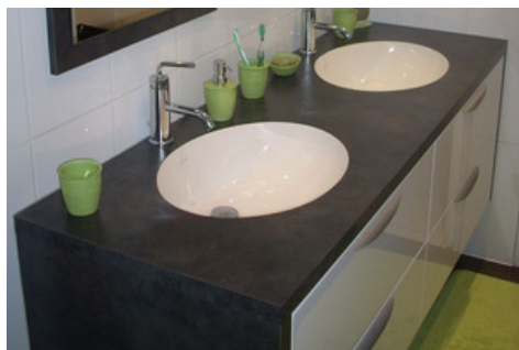
Plan de vasque